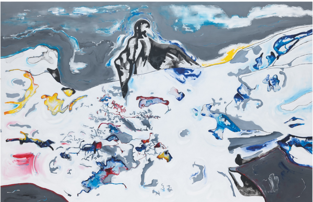
‘When a Body Becomes a Landscape’, Grace Schwindt, 2024 © de kunstenaar, courtesy Galerie Peter Kilchmann Zurich/Paris

Hoewel Schwindt al langer tekent en schildert, werkt ze pas sinds kort op doek, en dit zijn haar eerste werken op zulk een monumentaal formaat. Deze schilderijen tonen hoe ze op vernieuwende wijze sculpturale referenties vertaalt naar de schilderkunst.