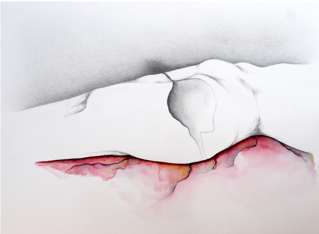
'Leg Resting', Grace Schwindt, 2024 © de kunstenaar, courtesy Galerie Peter Kilchmann Zurich/Paris

Schwindt werkte met aquarelverf, waardoor het wit van het papier een levendig onderdeel van het werk blijft. Fijne lijnen wisselen af met diepe inktvlekken en felle kleuren, wat een fragiele maar krachtige uitstraling geeft.