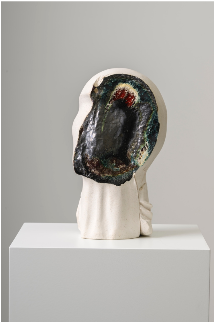
'Head and Figure', Grace Schwindt, 2022

Harde materialen zoals brons contrasteren met het kneedbare, breekbare keramiek, wat de balans tussen kwetsbaarheid en veerkracht versterkt.